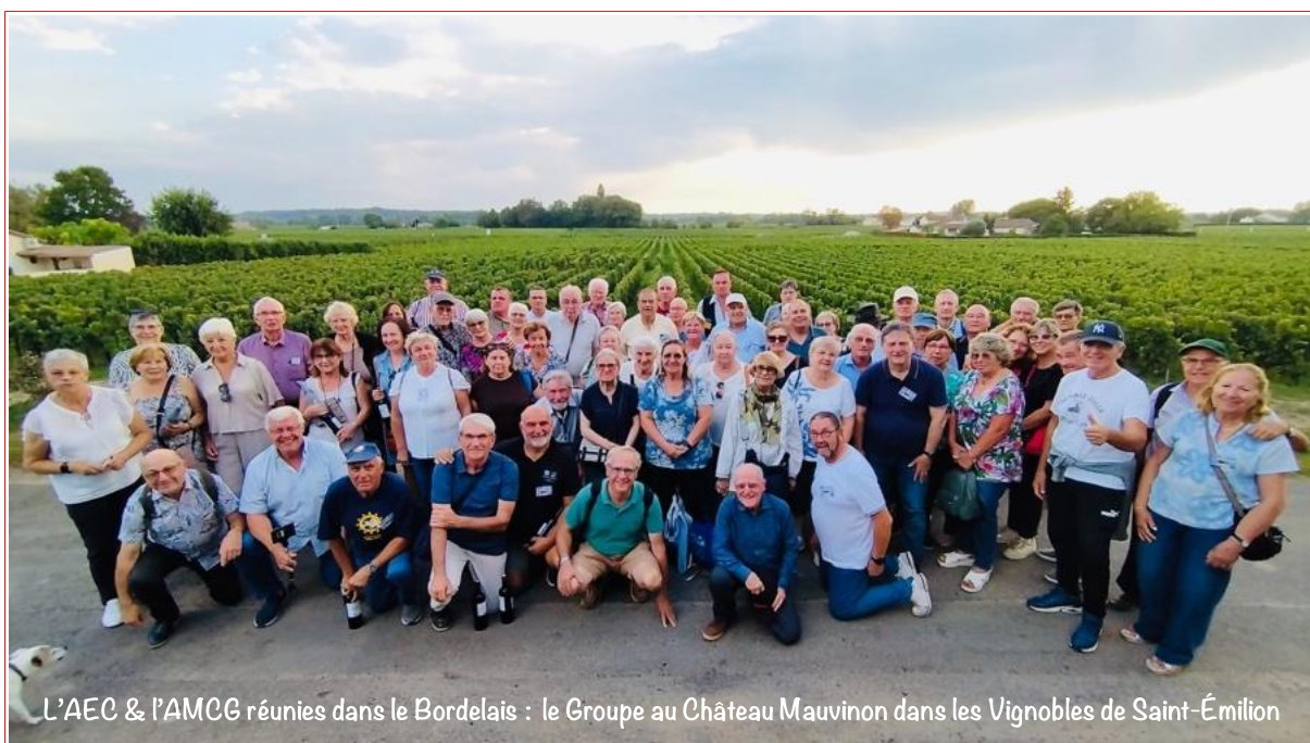
L'AEC & l'AMCG réunies dans le Bordelais : le Groupe au Château Mauvinon dans les Vignobles de Saint-Émilion

Prix : 3,00 € - Décembre 2025 - N° 320 - Dépôt légal : Quatrième Trimestre