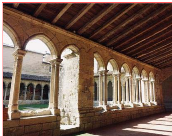
Les deux Colonne rostrales dominant la Place des Quinconces à Bordeaux La Locomotive 020 T 4210 en Monument devant la Gare de Guitres, Point de Départ du TTGM Le Clocher de l'Église monolithe apparaît dans l'Arche de la Porte de la Cadène à Saint-Émilion Le Cloître du Chapitre contigu à la Collégiale de Saint-Émilion L'Image du Groupe AEC / AMCG au Château Mauvinon